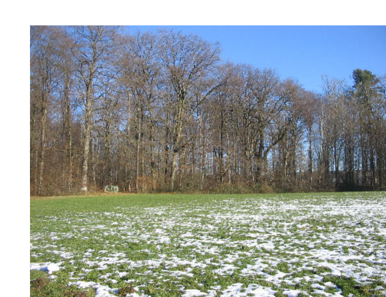
Kunststandort 8: Waldrand bei Mochenwangen