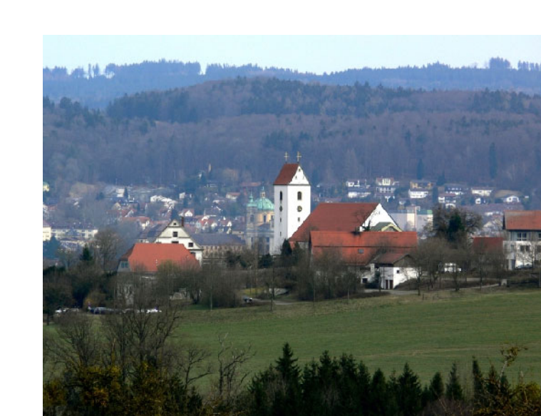
Kunststandort 9: Berg