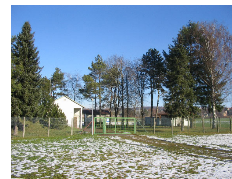
Kunststandort 6: Pumpwerk "Brühl" Baidt