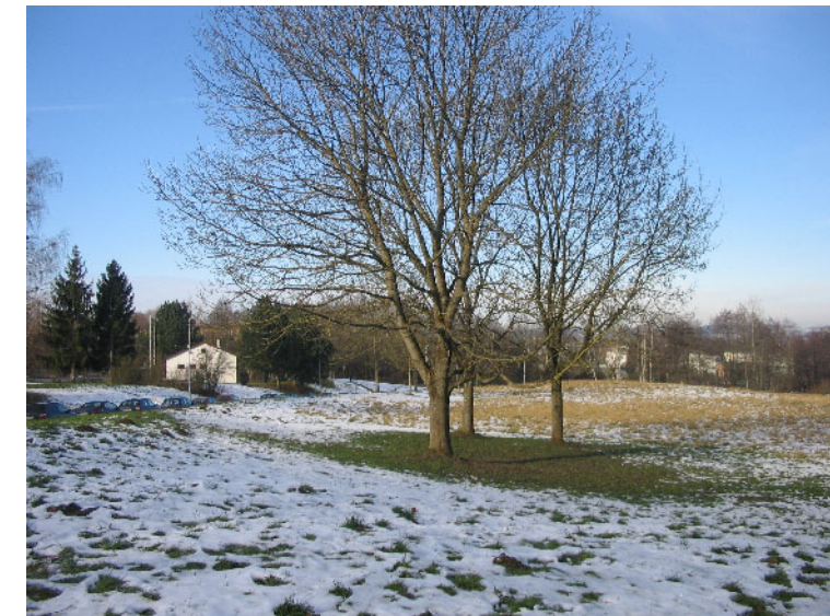
Kunststandort 1: Haslachstraße Weingarten