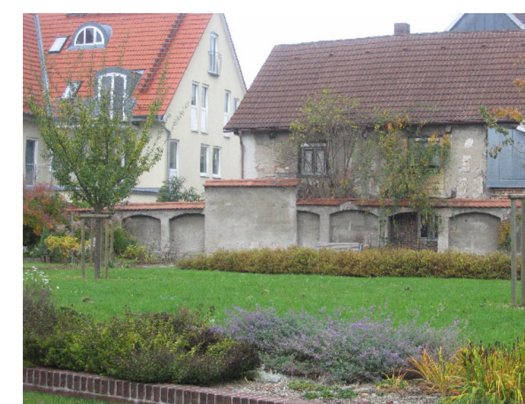
Kunststandort 2: Schloßlegarten Weingarten