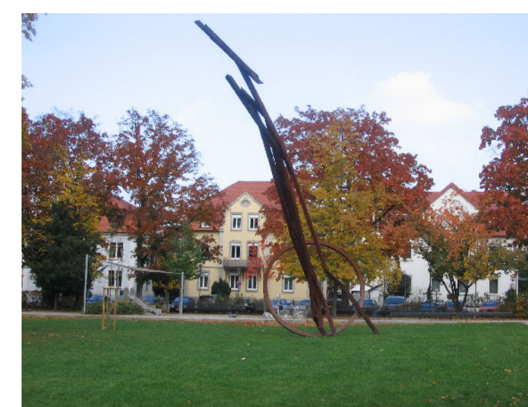
Kunststandort 3: Stadtgarten Weingarten