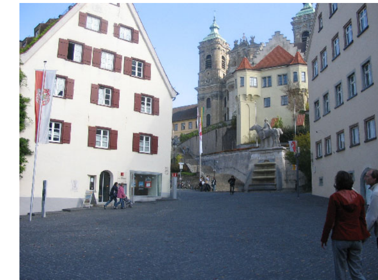
Kunststandort 4: Münsterplatz Weingarten