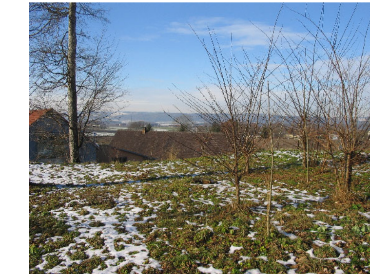
Kunststandort 7: Alte Pfarrkirche Kloster Baidt