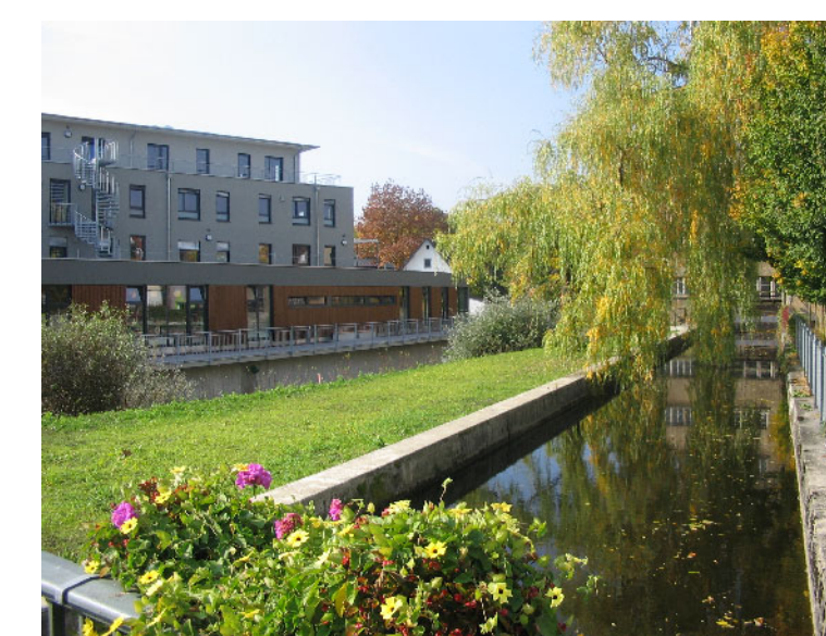
Kunststandort 5: Kunstinsel Baienfurt